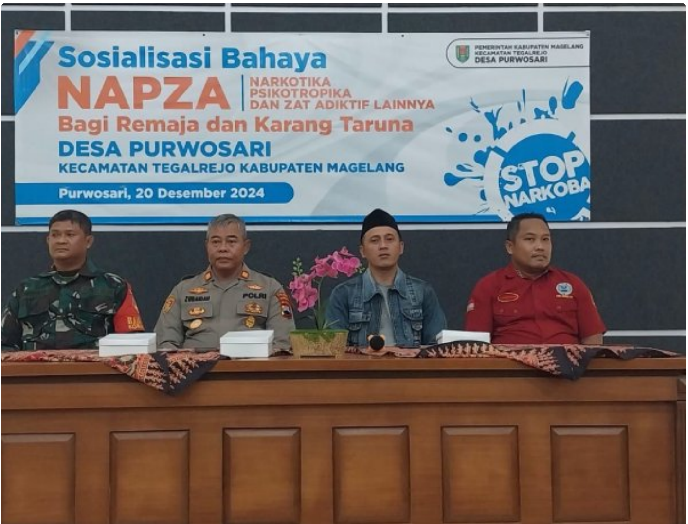
(Foto Dokumen) : Kegiatan sosialisasi bahaya narkoba dan kenakalan remaja

MAGELANG - Anggota Koramil 09/Tegalrejo bersama Polsek setempat dan anggota BNN memberikan sosialisasi tentang bahaya narkoba dan kenakalan remaja kepada anak-anak remaja Karang Taruna Desa Purwosari, Kecamatan Tegalrejo. Jum'at (21/12/2024).